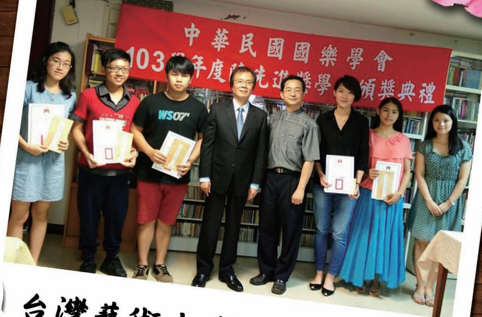
台灣藝術大學得獎者合影