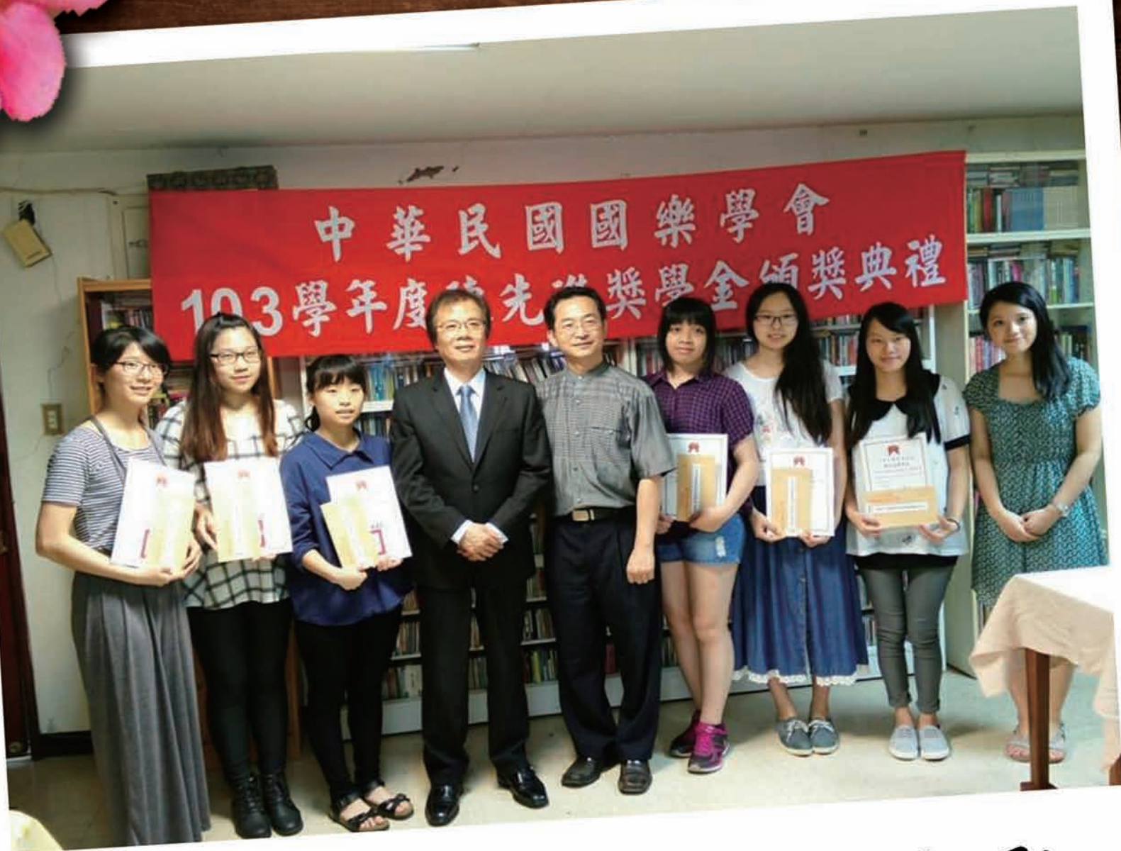
中國文化大學得獎者合影