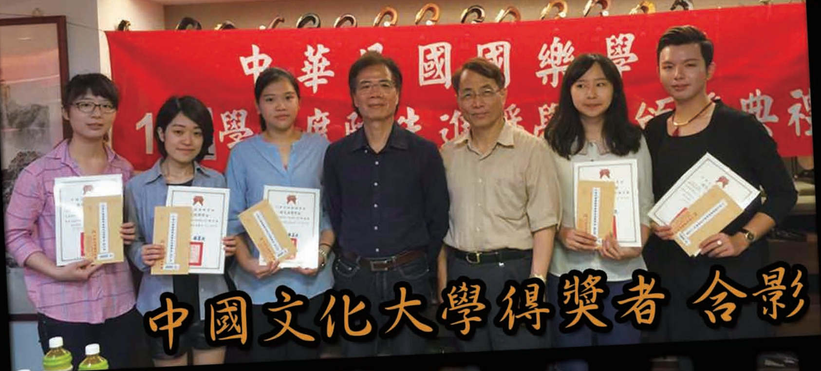
中國文化大學得獎者合影